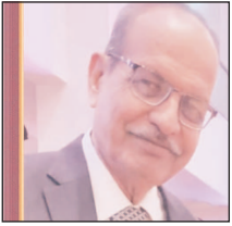
व्यंग्य/ शशिकांत गुप्ते