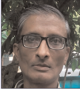
प्रिंस अभिशेख अज्ञानी

नवयुवा भी गूगल आदि पर पुस्तकें पढ़ने को सहज, सुलभ, आरामदेह व अपनी प्रवृत्ति/रूचि के अनुरूप निरूपित करने लगे हैं और इसमें सच्चाई भी है। समस्या यह है कि समाज संवाद माध्यम के विभिन्न अंग बेहद चित्ताकर्षक व व्यापक होने से पुस्तक पढ़ने हेतु उद्यत हुआ व्यक्ति भी नकारात्मक-निरर्थक-अश्लील या बेहूदा क्षेत्र (साइट) में प्रवृत्त होकर अपना ध्येय भूल जाता अथवा छोड़ बैठता है। ऐसा नहीं कि पुस्तकों में यह सब नहीं होता बल्कि पुस्तकों में जो होता है, प्रायः वही समाज संवाद माध्यम में दृश्यमान होता है लेकिन पुस्तकों का पाठक एक समय में आमतौर पर एक ही क्षेत्र की पुस्तक पढ़ने में सक्षम हो पाता है। मसलन पाठ्यपुस्तक, साहित्यिक, शैक्षिक, आपराधिक या अन्य।